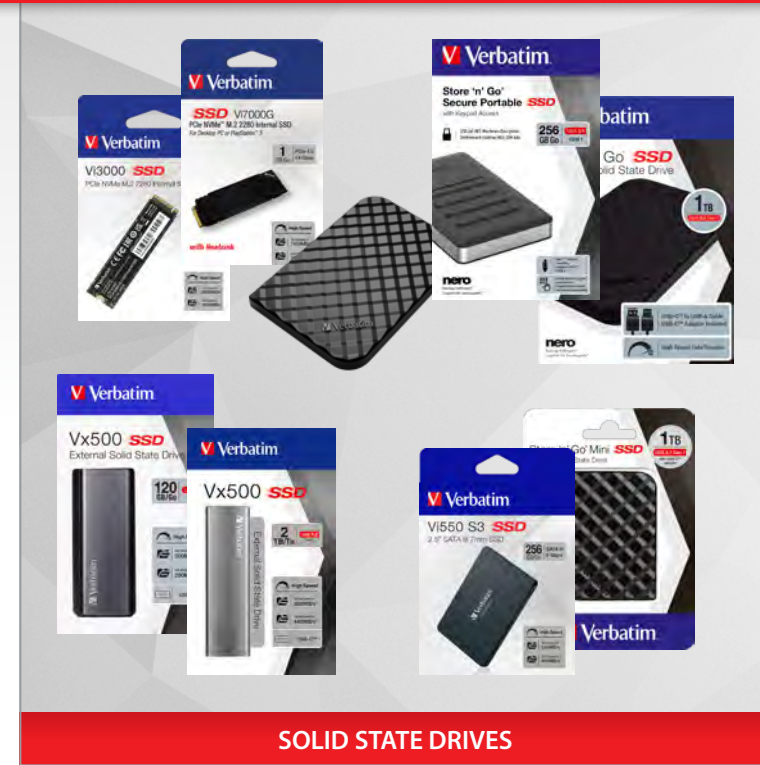
SOLID STATE DRIVES

Als extrem schnelle Alternative zu herkömmlichen Festplatten bietet unser Sortiment an Solid State Drives (SSD) eine besonders leistungsfähige Auswahl aktueller interner und externer Modelle.