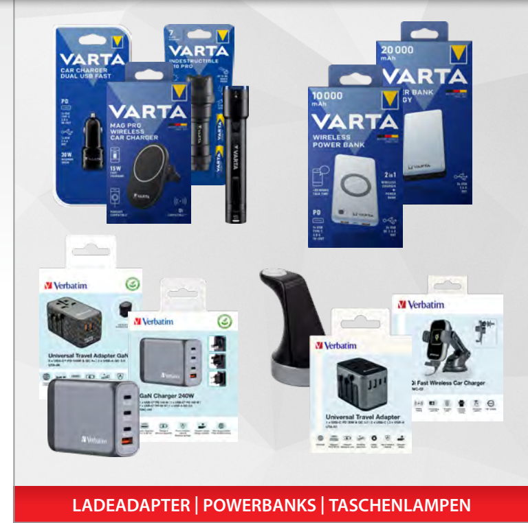
LADEADAPTER | POWERBANKS | TASCHENLAMPEN

Wir bieten eine große Auswahl an vielfältigen Ladeadaptern, leistungsstarken Powerbanks sowie zuverlässigen LED-Taschenlampen.