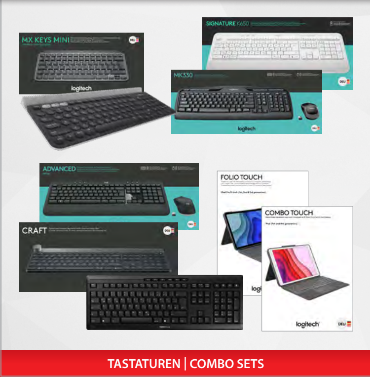
TASTATUREN | COMBO SETS

Wir bieten eine große Auswahl an kabelgebundenen und kabellosen Tastaturen, Folio-Tastaturen für Tablets sowie Combo Sets (Tastatur & Maus) in zahlreichen Größen und mit unterschiedlichsten Zusatzfunktionen.