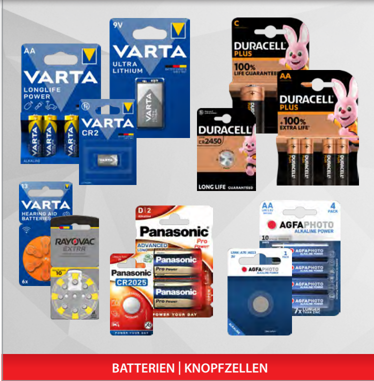
BATTERIEN | KNOPFZELLEN

Unser Sortiment umfasst eine breite Auswahl verschiedenster Batterien und Knopfzellen in diversen Bauformen zahlreicher namhafter Hersteller.