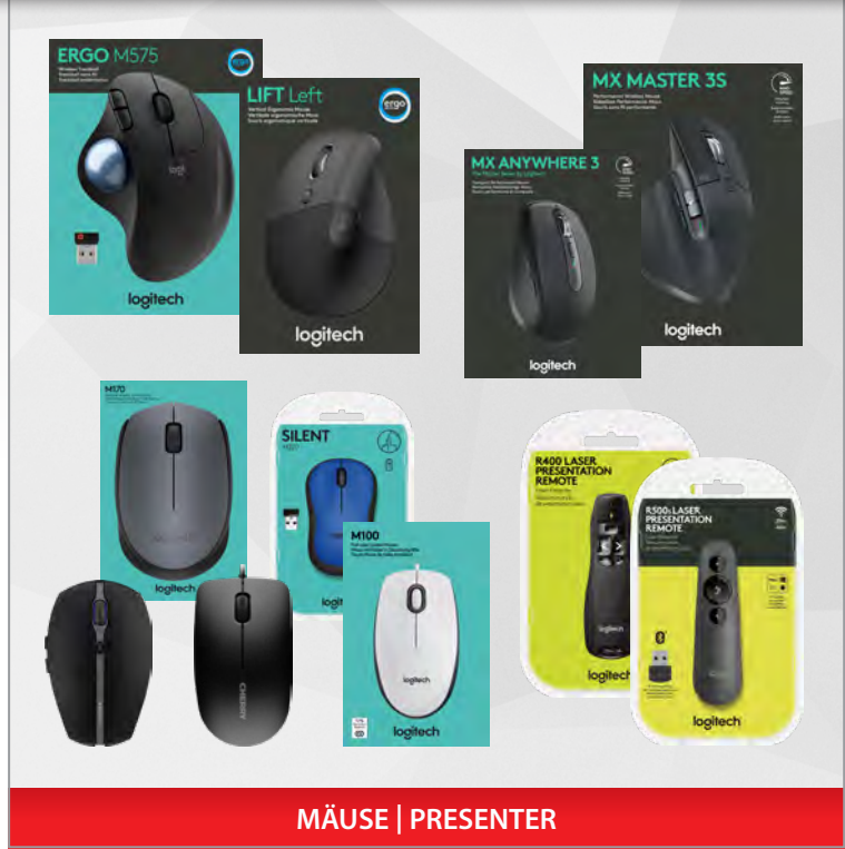
MÄUSE | PRESENTER

Sowohl im Bereich der Mäuse als auch bei Präsentern bietet Logitech eine Vielzahl an Innovationen, um die Benutzung so komfortabel wie möglich zu gestalten – natürlich sowohl für Rechts- als auch für Linkshänder.