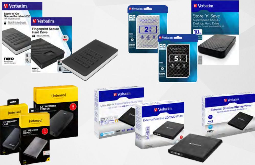
FESTPLATTEN | LAUFWERKE

Festplatten führen wir in allen gängigen Kapazitäten, Baugrößen und mit allen aktuellen Schnittstellen. Darüber hinaus bieten wir verschiedene Spezialfestplatten – insbesondere Security-Lösungen – an. Zudem umfasst unser Sortiment alle gängigen Varianten interner und externer optischer Laufwerke sowie Diskettenlaufwerke.