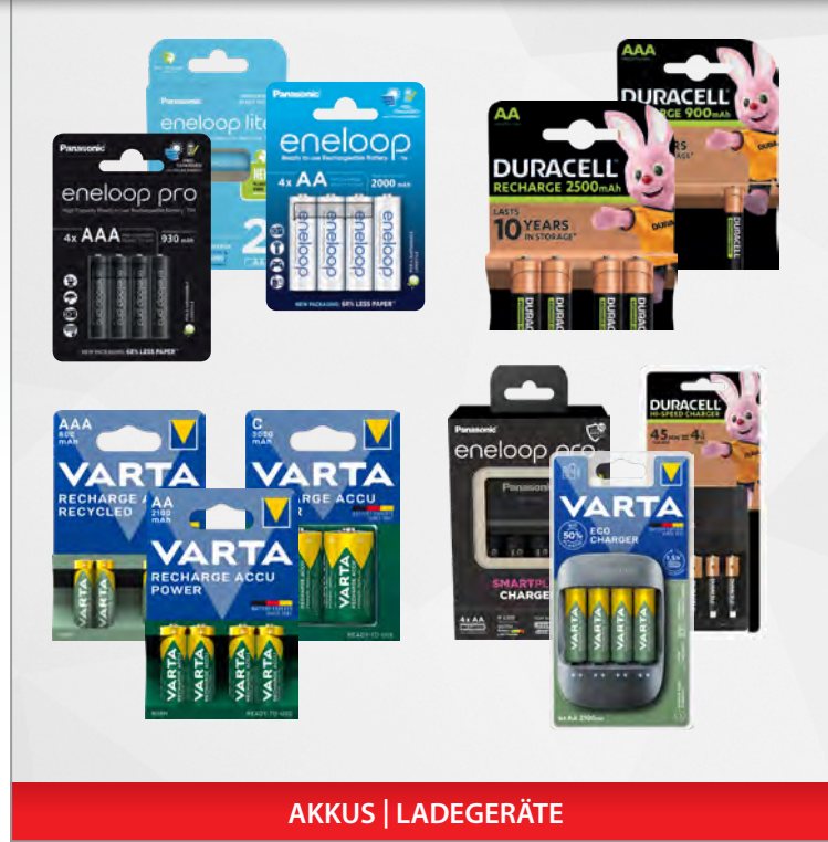
AKKUS | LADEGERÄTE

Im Bereich der wiederaufladbaren Akkus führen wir neben verschiedenen Bauformen und Kapazitäten auch die geeigneten Ladegeräte.